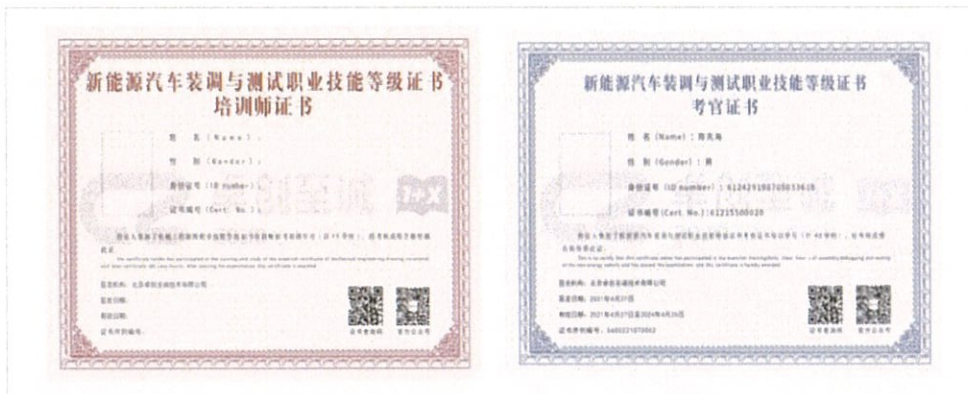
图1 新能源汽车装调与测试职业技能等级证书-培训师证书和考官证书

通过本次培训并考核合格的老师，将获得职业教育培训评价组织—北京卓创至诚技术有限公司颁发的新能源汽车装调与测试职业技能等级证书“培训师证书”和“考官证书”。同时还将获得作为国家级职业教育“双师型”教师培训基地-云南交通职业技术学院颁发的结业证书。